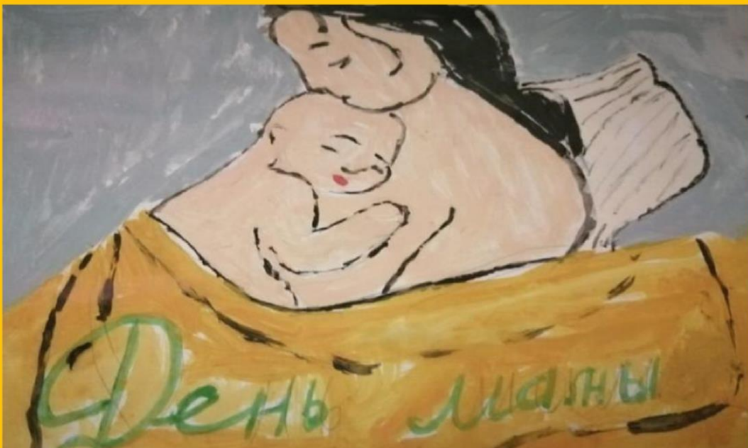
Артём Паничкин, 14 лет, с. Солнечное