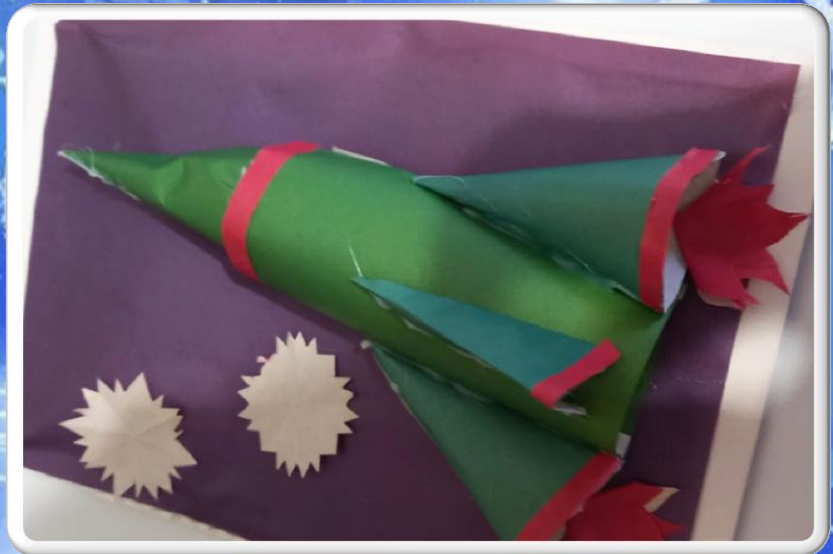
Творческие работы Ольги Б. с. Березовка