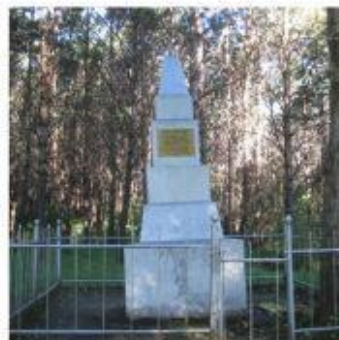
Памятник Г.Я.Воронову и Л.Т.Кирею