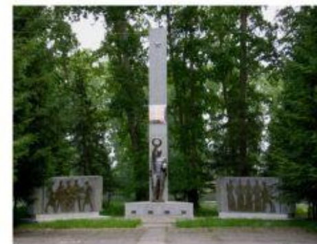
Памятник жителям Ивановского района, погибшим в годы ВОВ 1941-1945 гг.