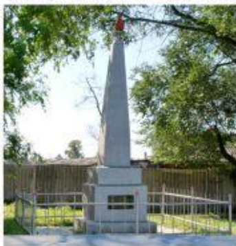
Памятник жертвам японских интервентов