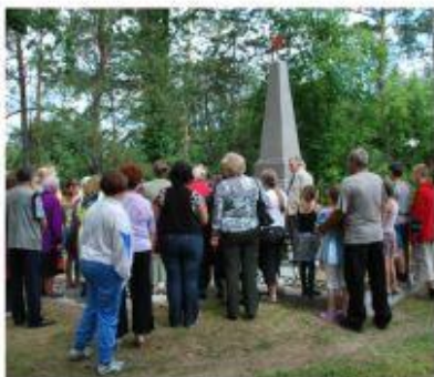
Памятник 257 мирным жителям, расстрелянным 22 марта 1919 г.