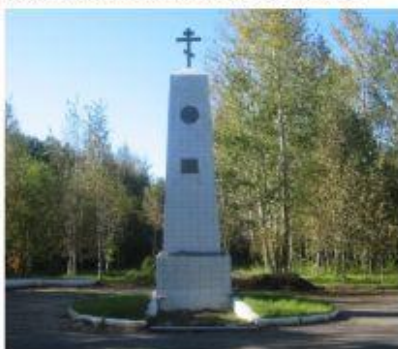
Памятник жителям, погибшим в годы японской интервенции