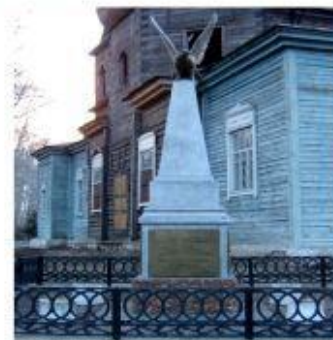
Памятник Г. Т. Бондаренко