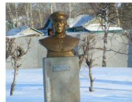
Памятник А. И. Галушкину