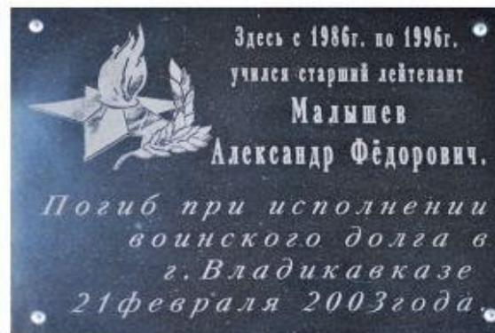
Мемориальная доска памяти А.Ф.Мальшева на здании Ивановской МСПОШ. Открыта в 2003 г.