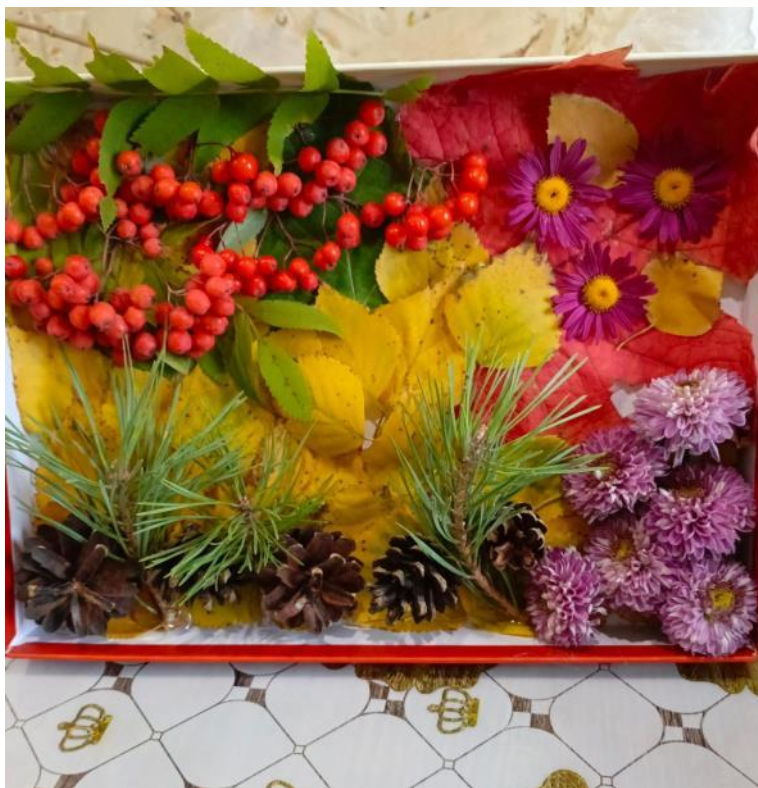
Дегтярёва Ксения с. Петропавловка