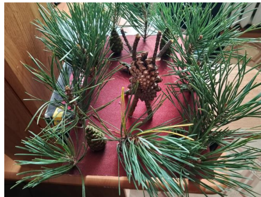
Сычев Данил С. Константиноградовка