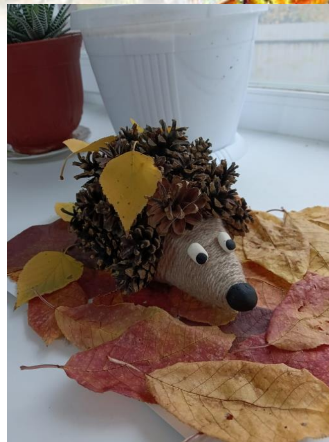
Пакулов Илья с. Березовка