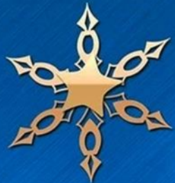
Глеб М. из с. Ивановка