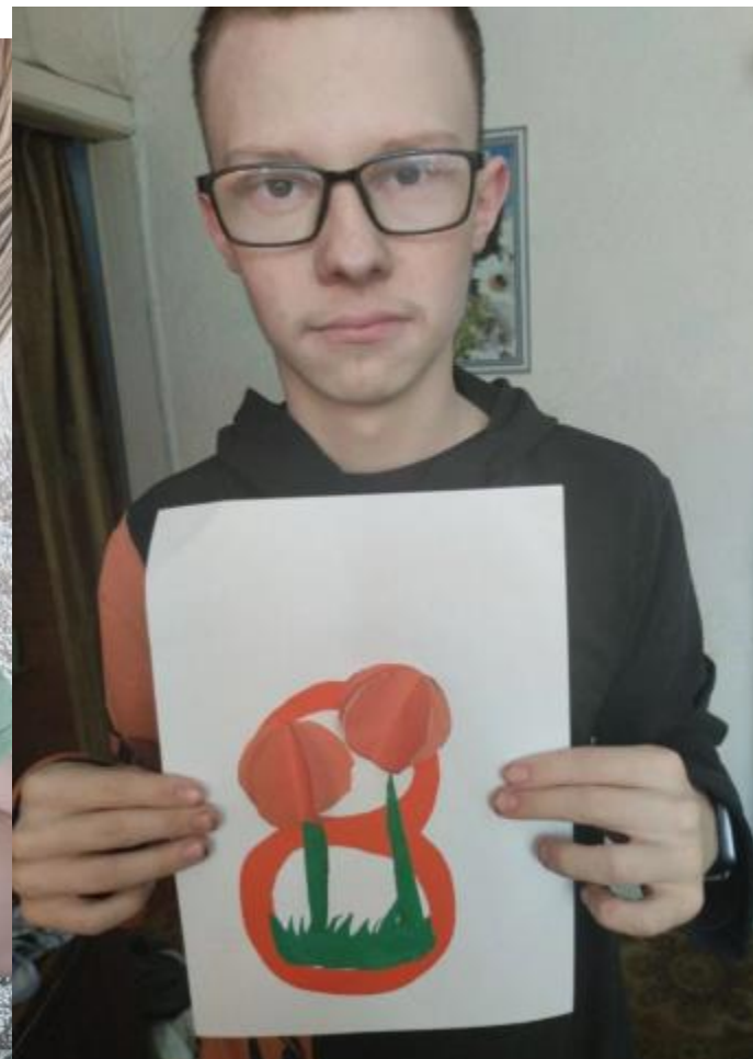
Роман П. с. Березовка